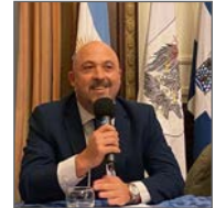
Esc. Julián Gonzalez Mantelli

4- Se automatiza bianualmente la actualización de montos a considerar (30/6 y 31/12) que regirán por cada semestre.